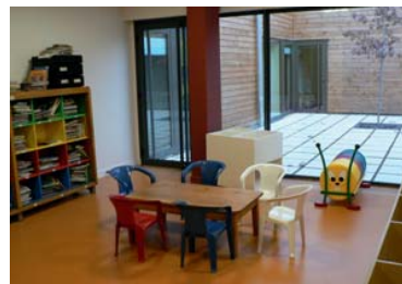
École Jean Zay

L'adjointe à la vie scolaire a été l'interlocutrice attentive des différents partenaires que sont les enseignants, les personnels, les parents d'élèves et leurs associations, les autorités. Elle participe avec d'autres élus aux conseils d'école.