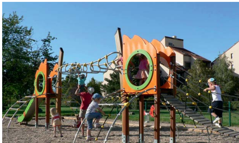
Jeux du Parc de La Mourette