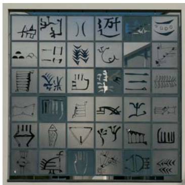
Maison des Beaumontois