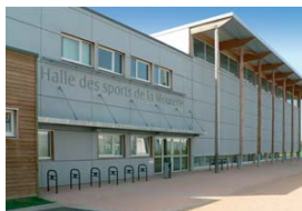
La Halle des Sports

Plusieurs bâtiments ont été réalisés dans la logique HQE (Haute Qualité Environnementale) : la Halle des Sports et l'école maternelle Jean Zay ont obtenu ce label et... les subventions qui vont avec. Cette recherche de Haute Qualité Environnementale est aussi un des critères de réalisation du quartier Del Pla qui, du coup, bénéficie de son inscription en Zone Pilote d'Habitat par Clermont Communauté.