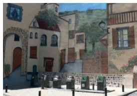
Poubelles enterrées place Montehus

ont été installées place Montehus et place Notre-Dame de La Rivière. Le tri sélectif a été renforcé, en liaison avec notre opposition à l'incinérateur. La récupération des piles et des portables a été proposée en faveur d'actions humanitaires.