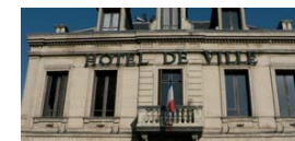
La mairie sera restructurée

Nous vous proposons que le nouveau "Cœur de Ville" de Beaumont soit un quartier modèle et exemplaire. Bénéficiant déjà des orientations Haute Qualité Environnementale qui lui ont permis d'être labellisé Zone Pilote d'Habitat par Clermont Communauté et par le Grand Clermont, nous ferons du "Cœur de Ville" un écoquartier de référence : mixité sociale et générationnelle, habitat à énergie passive peu consommateur d'énergie, récupération des eaux pluviales, place des piétons et cyclistes, gestion du stationnement, etc.